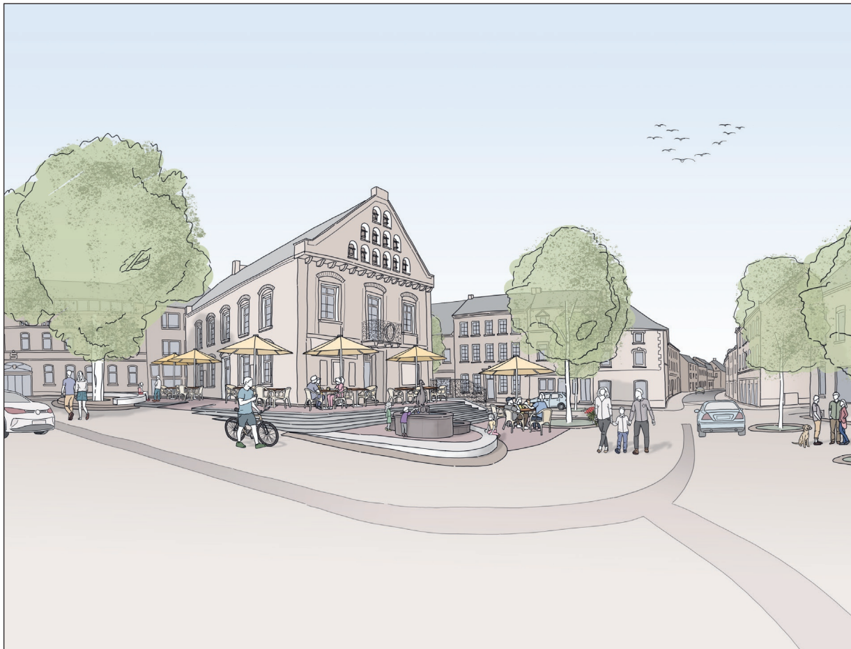
Visualisierung der Neugestaltung des Marktplatzes Gangelt (Städtebauförderung)